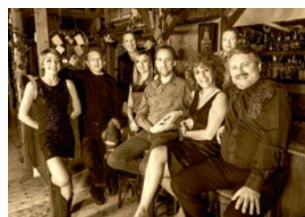
Full Moon Rodeo präsentiert von Ernst Frey AG, Kaiseraugst