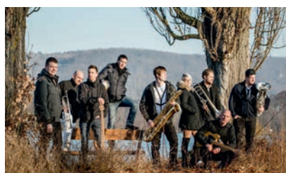
Soulmine präsentiert von Schneider Sanitär + Spenglerei AG, Pratteln