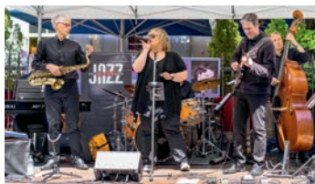
Just Jazz präsentiert von Schär Getränke, Obermumpf