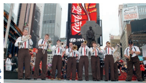
Bluesbuebe 1966 präsentiert von Schreinerei Schneider AG, Pratteln