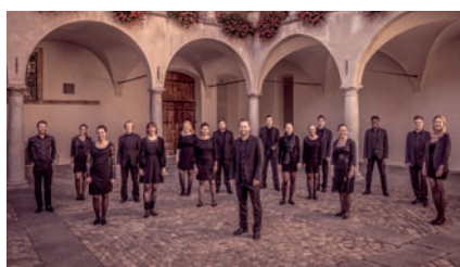
Ensemble Cantalon präsentiert von Thommen AG, Kaiseraugst