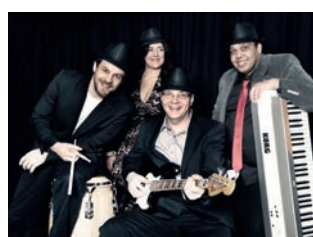
Flugmodus präsentiert von A+F Brandschutz GmbH, Basel