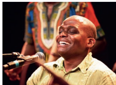
Xipenda präsentiert von Brauerei Farnsburg AG, Sissach