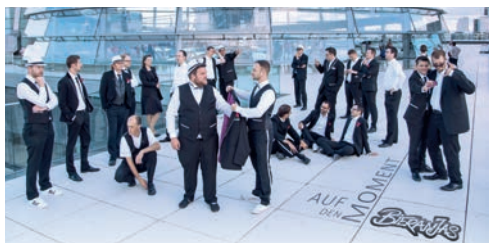
Bieranjas präsentiert von Brüderli Gastronomie, Pratteln