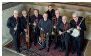
Steppin Stompers präsentiert von BSK Baumann + Schaufelberger Kaiseraugst AG