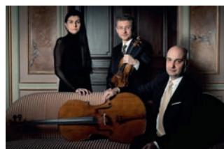
Spyros Trio präsentiert von Solvias AG, Kaiseraugst